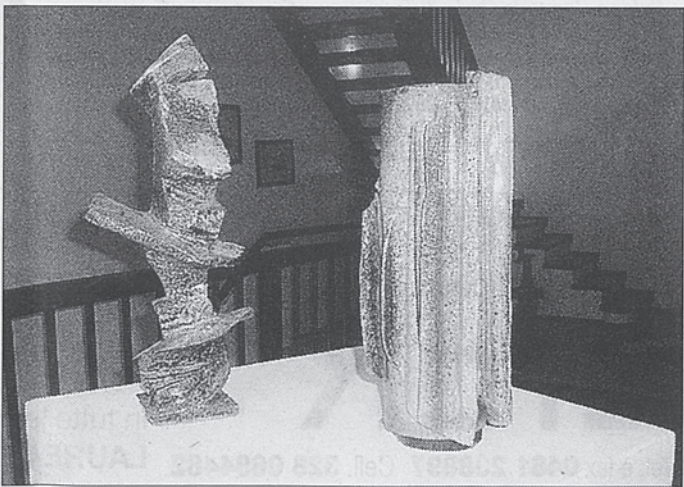
«La vie en rose», di Anderle, e in alto un'opera di Demattè

legno. Mai stanco di sperimentare, dimostra un percorso coerente e la ceramica apre a mille percorsi differenti. Sculture che non possiedono una funzionalità, perché i vasi non sono vasi e i piatti tendono a scomporsi in geometrie che fanno equilibrismo. Sculture spesso frastagliate da buchi e lacerazioni, sintomi di una ricer-